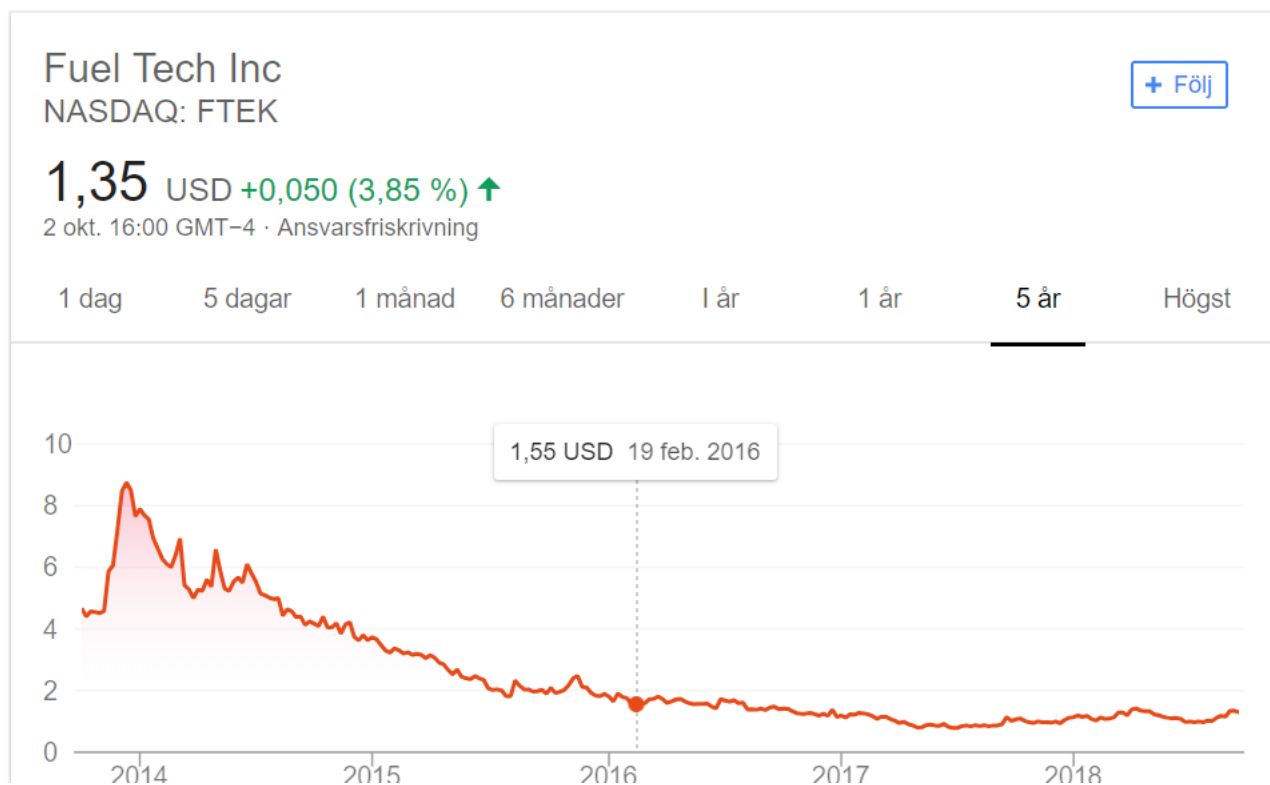
Figur 1: Värdeutveckling hittills